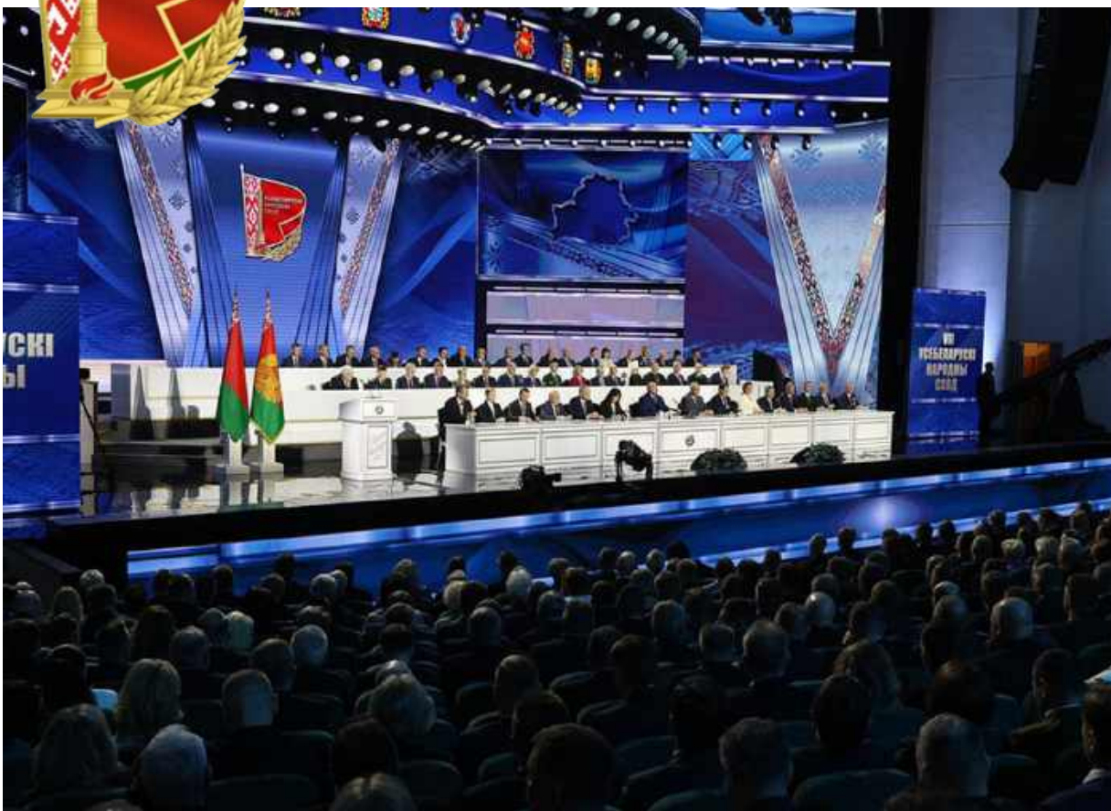
Первое заседание VII Всебелорусского народного собрания состоялось 24–25 апреля 2024 года