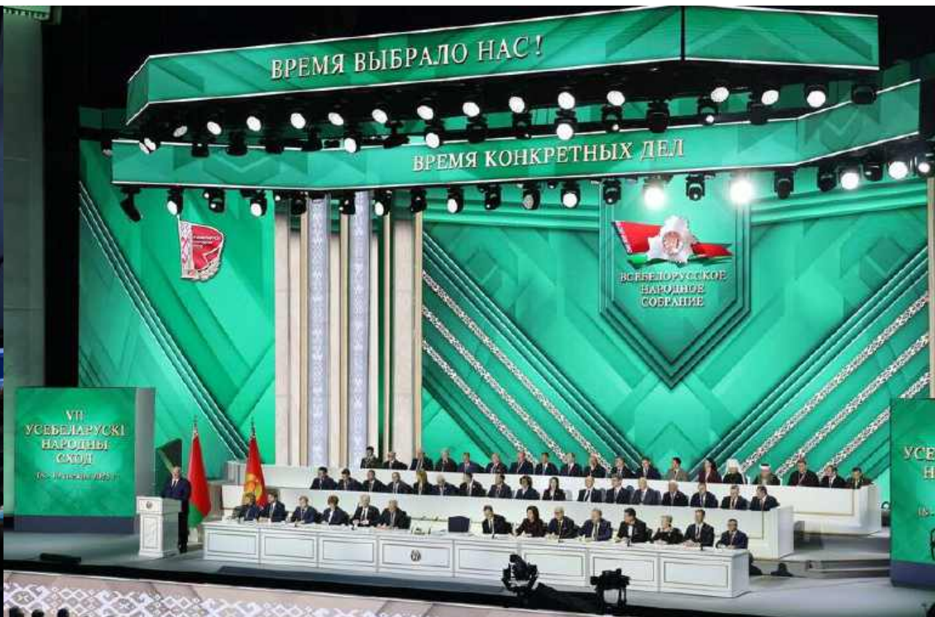
Второе заседание VII Всебелорусского народного собрания состоялось 18–19 декабря 2025 года